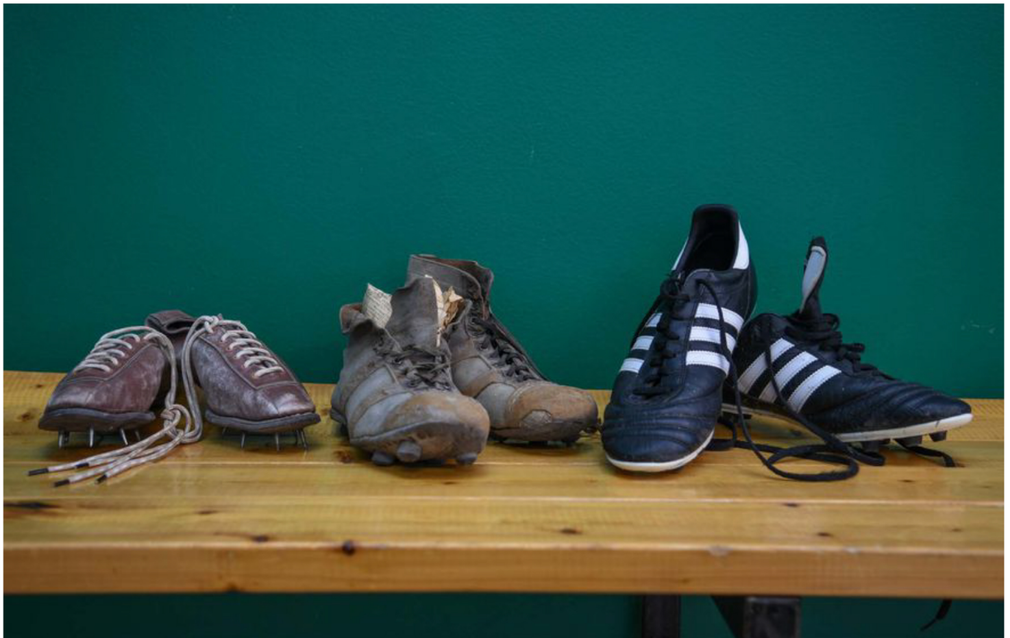
Fotbollsskor som finns sparade av Älgarna Härnösand-IF.