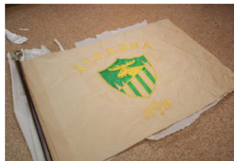
Lagets flagga från 1919.