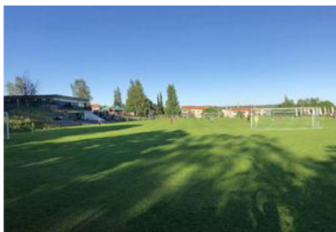
"Angevallen är den finaste planen som jag fotat på och det gör ont i hjärtat att planen ska rivras".

– Under åren har jag fått ett starkt band till Älgarna-Härnösand IF. De är ett härligt gäng med många duktiga spelare och engagerade eldsjälar. Klubbens historia är intressant. Speciellt storhetstiden under femtiotalet. Många spelare som fostrade i klubben har gått vidare till